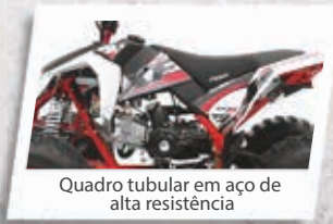
Quadro tubular em aço de alta resistência