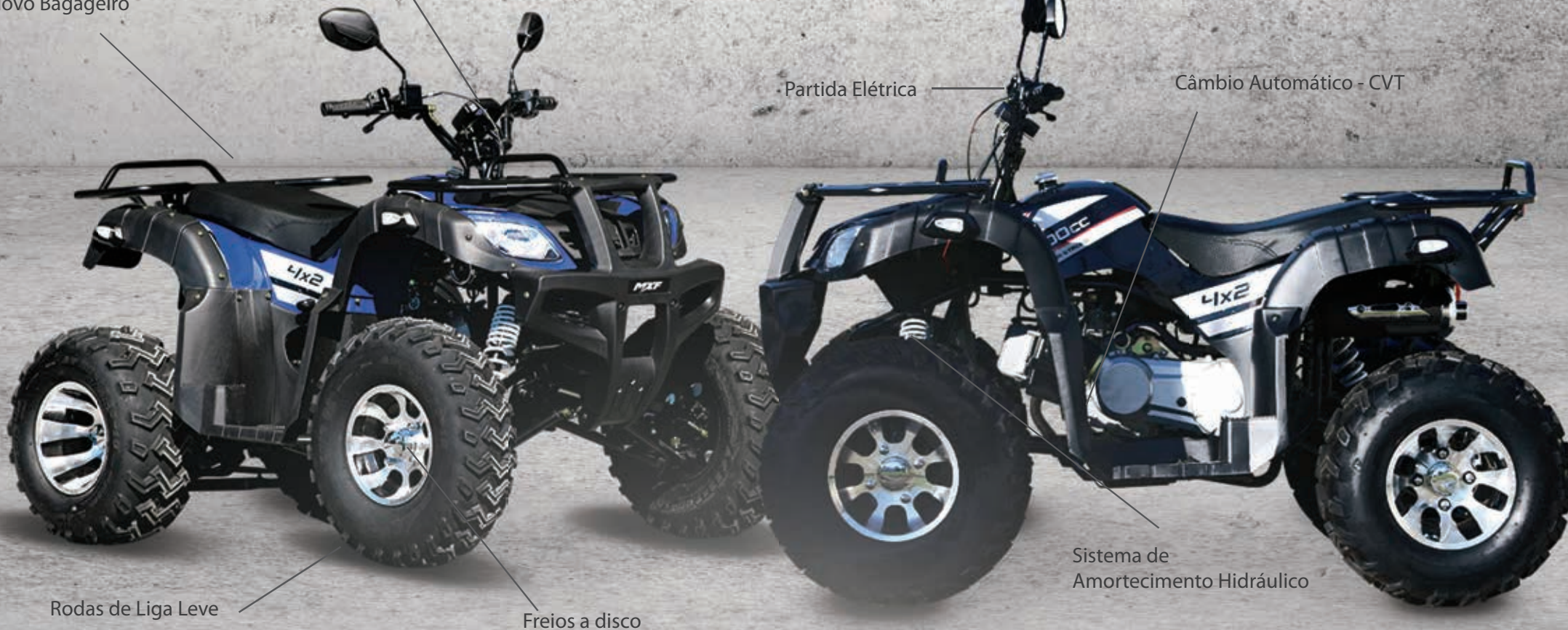
Rodas de Liga Leve