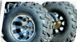
Rodas de Liga Leve